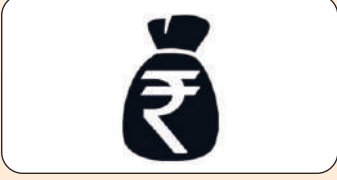
Personal Loan Int. @ 12.5%