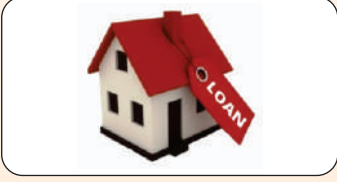
Housing Loan Int.@ 9.50%