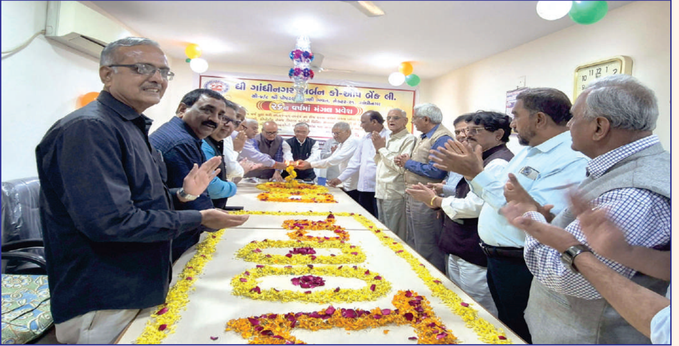
બેંકના રદમા સ્થાપના દિવસે રૂ. ૧૦૦ કરોડ ડિપોઝીટની સિધ્ધિ સાથે ઉજવણી કરતાં બોર્ડ ઓફ ડિરેક્ટર્સ તથા આમંત્રિત મહેમાનો