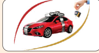
Vehicle Loan Int.@ 9%