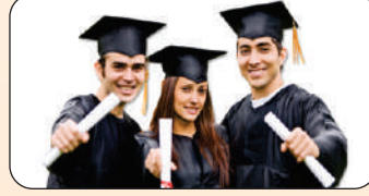
Education Loan Int. @ 10%