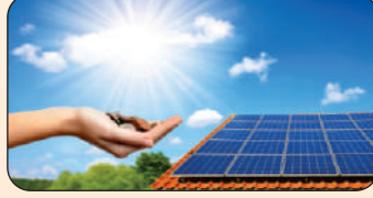
Solar Loan Int. @ 10%